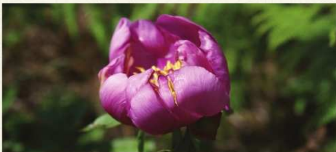
Rosa-albardeira - Paeonia broteri

Iguarias diversificadas à base de chicharo, fumeiros, cabrito assado, queijo Rabaçal DOP e doçaria local.