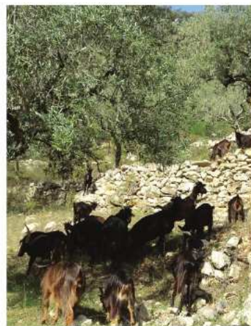
Rebanho de cabras