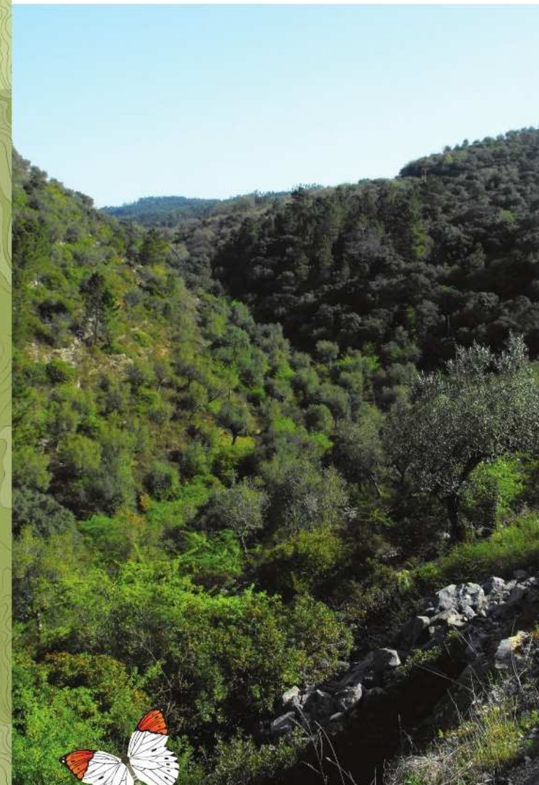
Vale da Mata