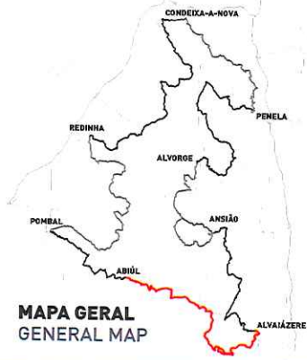
MAPA GERAL GENERAL MAP