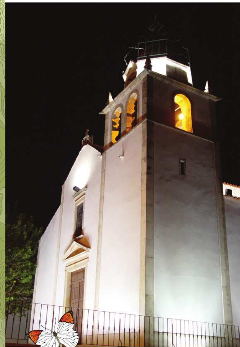
Igreja Matriz de Alvaiázere